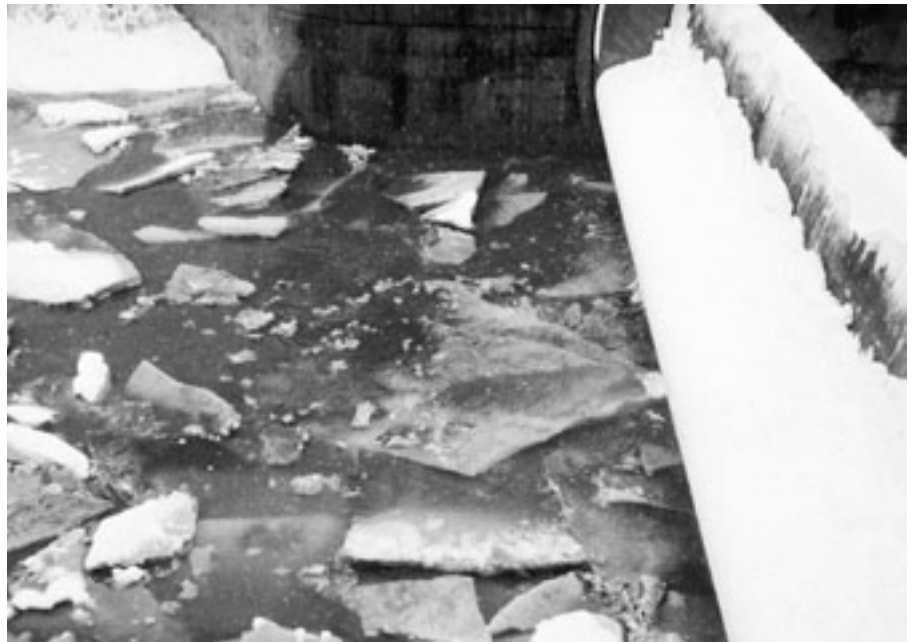
Treibt die Sihl grosse Eisschollen durch die Stadt könnten durch die gewaltigen Kräfte Brückenpfeiler zerstört werden...

das Projekt «Lebensraum Sihl» vor. Einerseits wird das Parkhaus über der Sihl in einigen Monaten endgültig entfernt. Andererseits wird gleichzeitig an vielen Stellen das Sihlufer wieder naturnah gestaltet und für den Menschen zugänglich und erlebbar gemacht. Diese Massnahmen sind immer auch unter den Aspekten des Hochwasserschutzes geplant. Vorgestellt wird auch das Eiswehr. Dieses ist im Zusammenhang mit dem Bau der Sihlhochstrasse erstellt worden und verhindert,