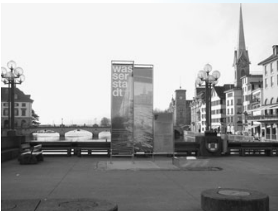
Im UNO-Jahr des Süsswassers zeigt sich Zürich als Wasserstadt.