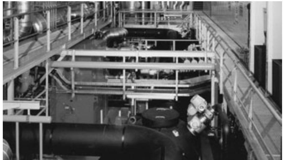
Die Wärmepumpe Walche, die grösste der Schweiz, gewinnt Wärme aus Limmatwasser.

Mancher Passant hat sich schon gefragt, was der Wasserstrudel in der Limmat neben der Museumsbrücke bedeutet. Doch kaum jemandem, der täglich durch das Walchetor spaziert, ist bekannt, dass sich unter dem Asphalt eine aussergewöhnliche