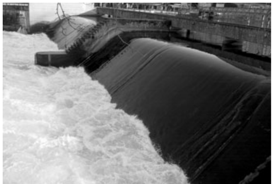
Das Lettenwehr am Ende des Platzspitzes regelt, wieviel Seewasser die Limmat hinunter fließt.

Auffallend sind die geringen Schwankungen des Zürichseespiegels. Wem aber ist bekannt, dass der Seeabfluss durch ein Wehr am Ende des Platzspitz geregelt wird? Ein einfacher, doch sehr wirkungsvoller Mechanismus – aufgrund seiner Form wird er «Dachwehr» genannt – regelt, wie viel Seewasser die Limmat hinunter fließt. Die Abflussmenge ist durch ein Reglement für die Wasserstände des