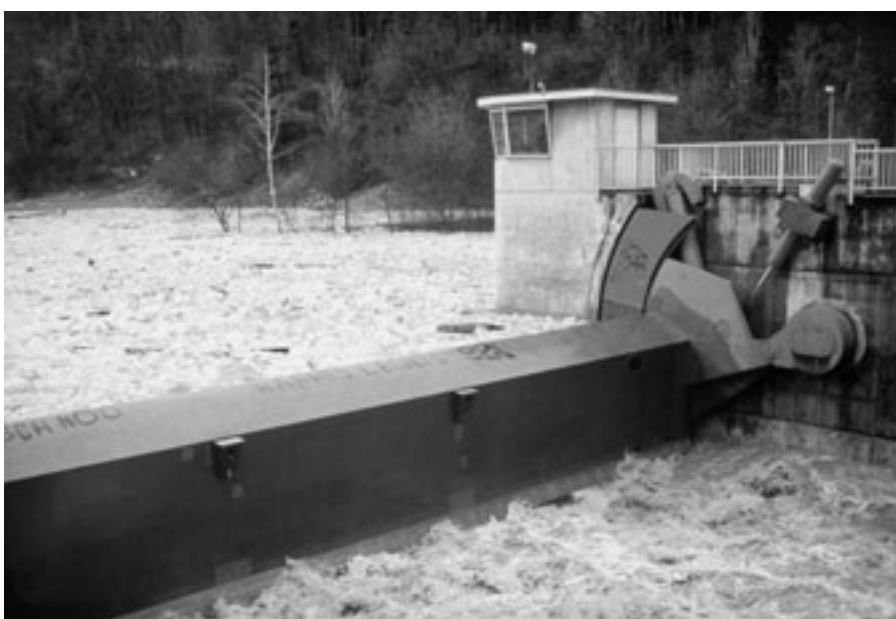
... das Eiswehr bei der Sihlhochstrasse verhindert dies.

Dem AWEL ist es gelungen, die nationale Grundwasser-Ausstellung des Ökologiezentrums Schattweid für Juli nach Zürich zu holen. In vier ausgebauten Übersee-Containern können sich Besucherinnen und Besucher auf spielerische Art mit Themen rund ums Grundwasser beschäftigen. Sie sehen, was Grundwasser ist und erfahren anhand eines Modells, unter welchem grossen Nutzungsdruck das Grundwasservorkommen und mit ihm die Trinkwasserversorgungen im Schweizer Mittelland stehen. Sie erkennen, dass gutes Grundwasser Grundlage für eine Versorgung mit gutem Trinkwasser ist und was sie zum Grundwasserschutz bei-