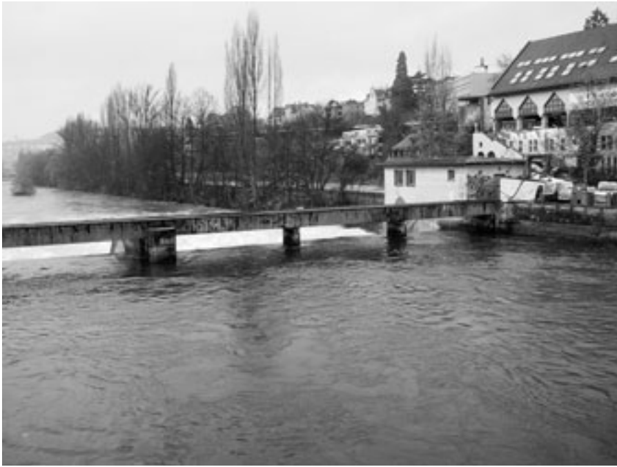
Gelassen fliesst die Limmat durch Zürich bis zum Lettenswehr.